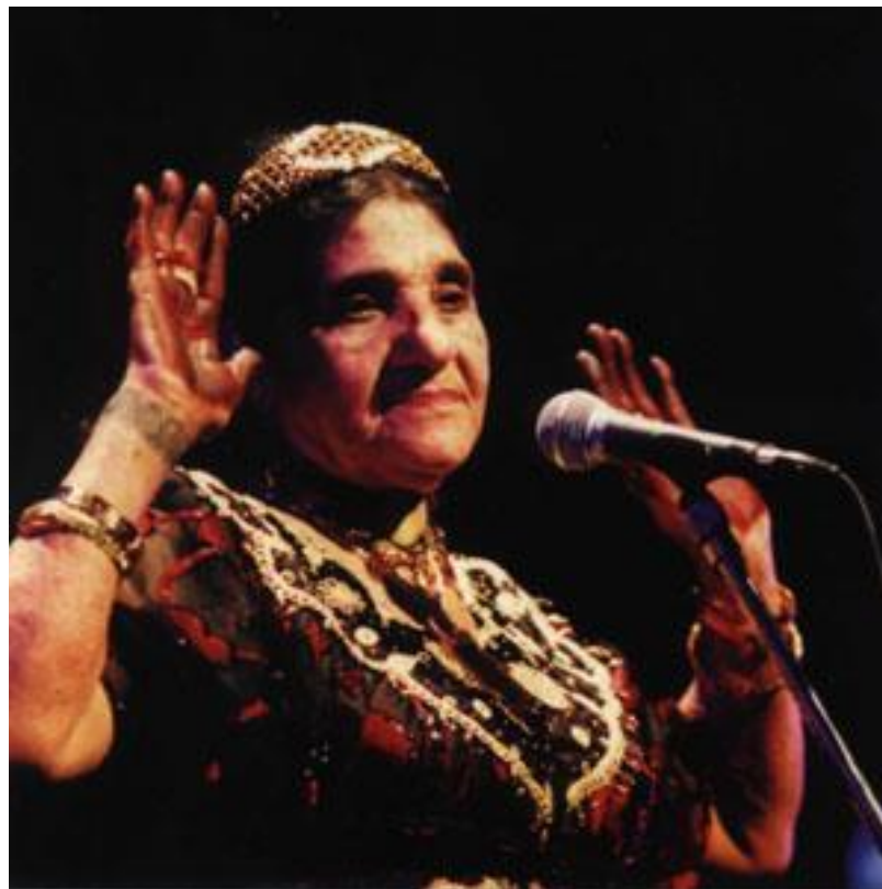
Le henné mythique de Chikha Remitti