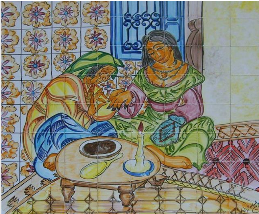
Un tableau mural publié par le site Bab Ezman