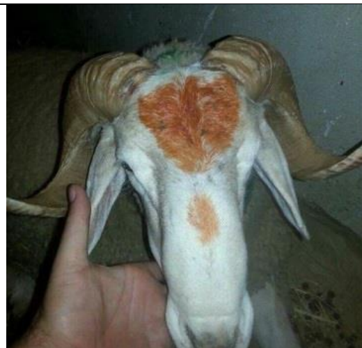
Mouton de l'Aïd Adha