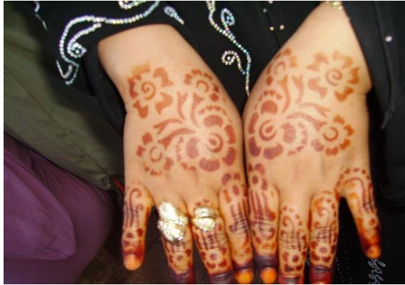
Henné aux mains