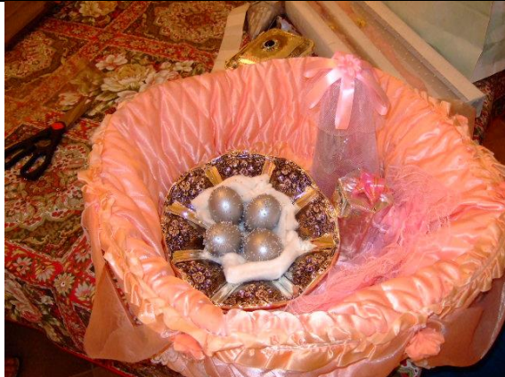
Œufs colorés argent