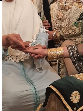
Pose du henné de la mariée