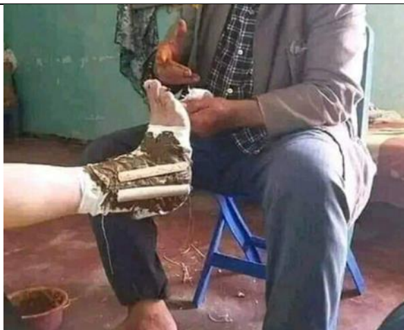
Soin des rhumatismes